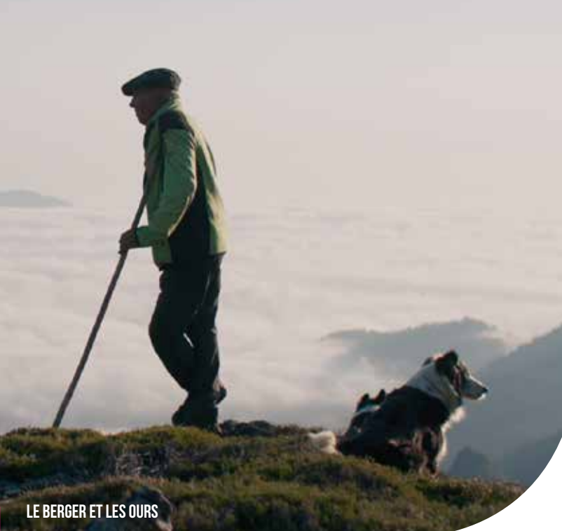
LE BERGER ET LES OURS