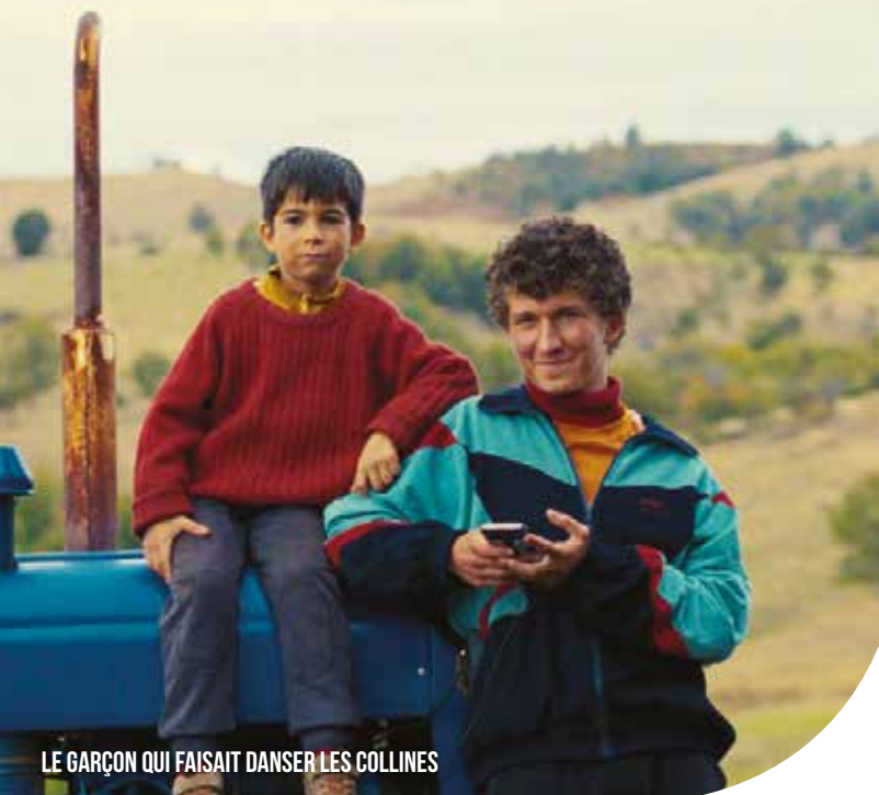
LE GARÇON QUI FAISAIT DANSER LES COLLINES