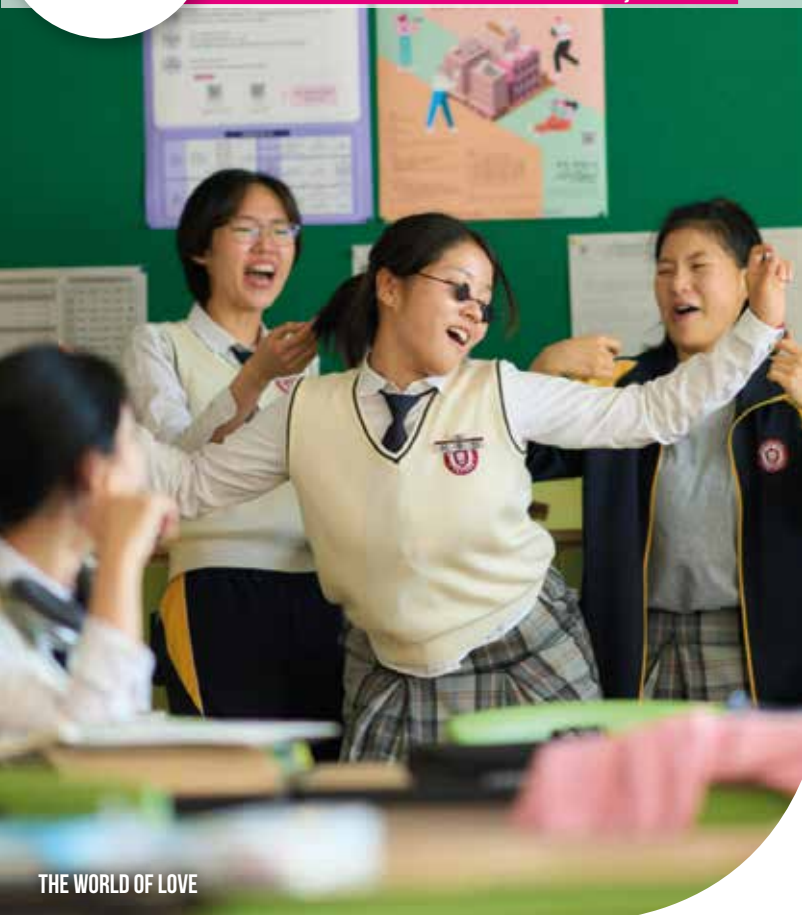
THE WORLD OF LOVE