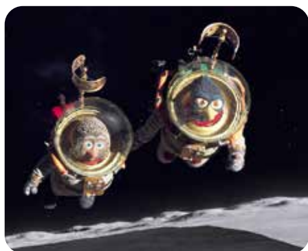
Le Voyage dans la lune de Rasmus A. Sivertsen