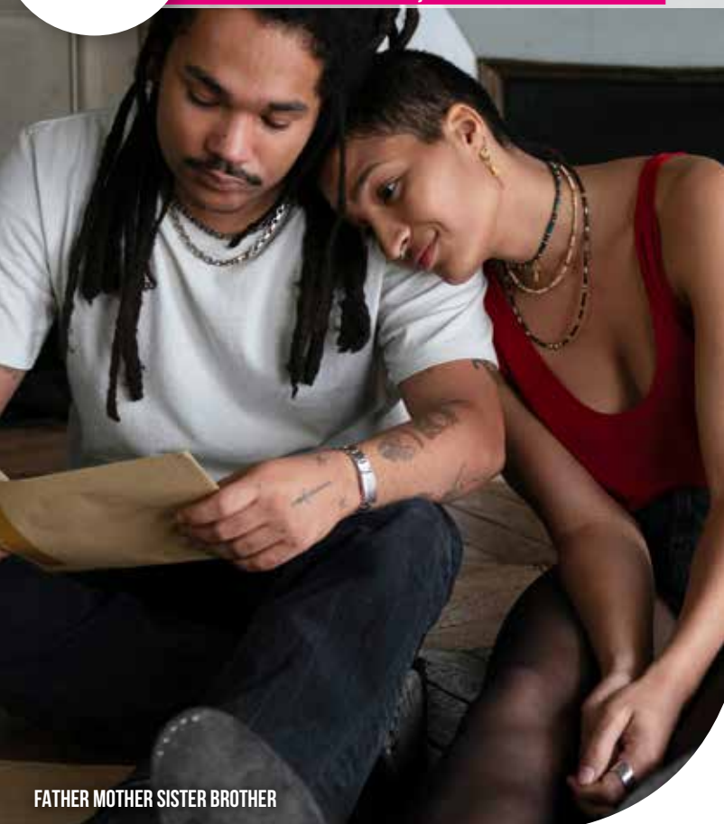
FATHER MOTHER SISTER BROTHER