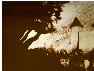
Don Giovanni / Cie de Poche / dessins sur sable : Yannick Barbe