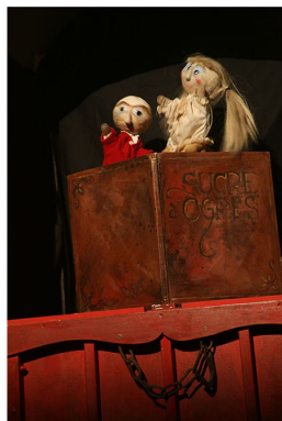
Sucre d'Ogres / Cie les Noodles / création marionnettes : Véro Frèche