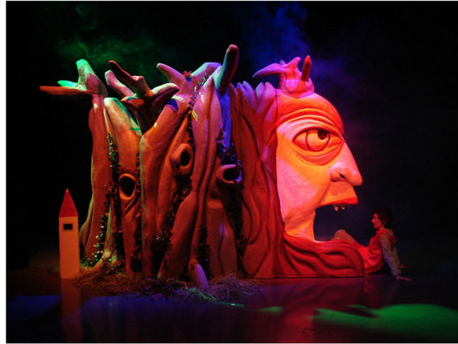
Même pas Peur / Cie les Noodles / création marionnette : Véro Frèche